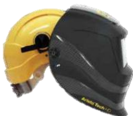
3: Adapter till skyddshjälm. Kan monteras på många fabrikat av skyddshjälm.