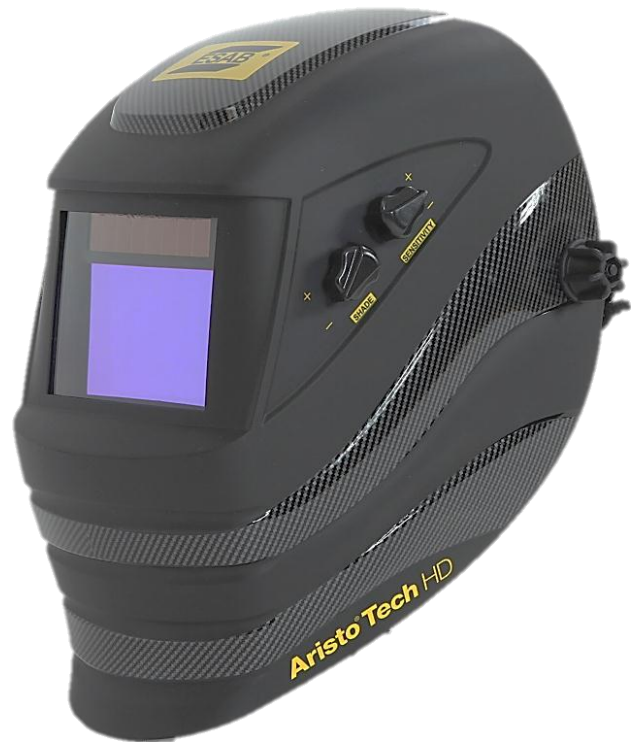
Aristo® Tech HD 5-13 med stort synfält, ny funktion X-TIG och modern design.

Svetshjälmens kassett är byggd på den senaste teknologin. För svetsaren visas aktuella inställda värden tydligt. Känslighet kan ställas in i 8 olika lägen, inkl slipläge. Fördröjningen, dvs tiden från mörk till ljus, anges i tiondelars sekunder från 0,1–3,5s.