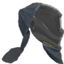
2: Huvud/nackskydd och bröstskydd

2 Bröstskydd i läder. 0700 000 062 2 Huvud- och nacksydd i läder. 0700 000 063 3 Adapter till skyddshjälm (Consept/Peltor) 0700 001 005